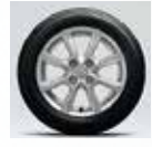
■14インチ アルミホイール