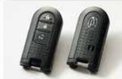
■オート格納式カラードドア ミラー (キーフリー運動)