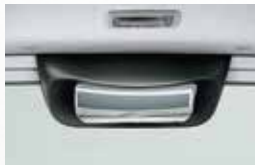
■リアアンダーミラー (室内付)