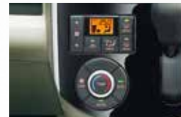
■オートエアコン (プッシュ式)