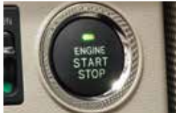
■プッシュボタンスタート & キーフリーシステム (イモビライザー (国土交通省認可品) 機能付・ リクエストスイッチ付 (運転席 / 助手席 / バックドア))