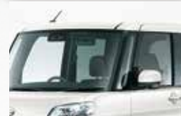
■スーパー UV & IR カット ガラス (フロントドア)