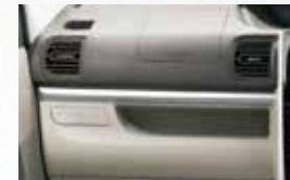
■シルバーインパネガーニッシュ (運転席 / 助手席)