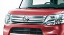
■メッキフロントグリル