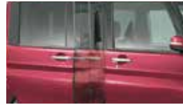
■右側パワースライドドア (ワンタッチオープン機能・予約ロック機能付)