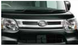
■メッキフロントグリル