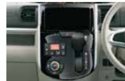
■センタークラスター (プレミアムシャインブラック)