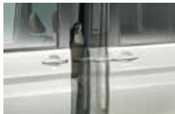
■左側パワースライドドア (ワンタッチオープン機能・ 予約ロック機能付)