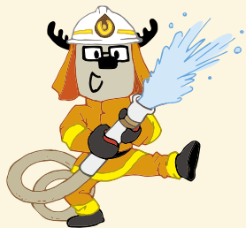
しょうぼうしさん