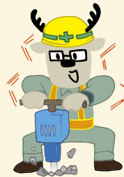
どぼくさぎょういんさん