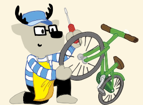
じてんしゃやさん