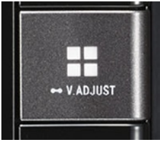
N209 ワイドスタンダードPlusメモリーナビ