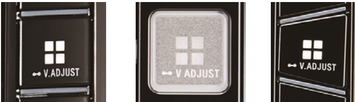
N207 8インチハイエンドメモリーナビ